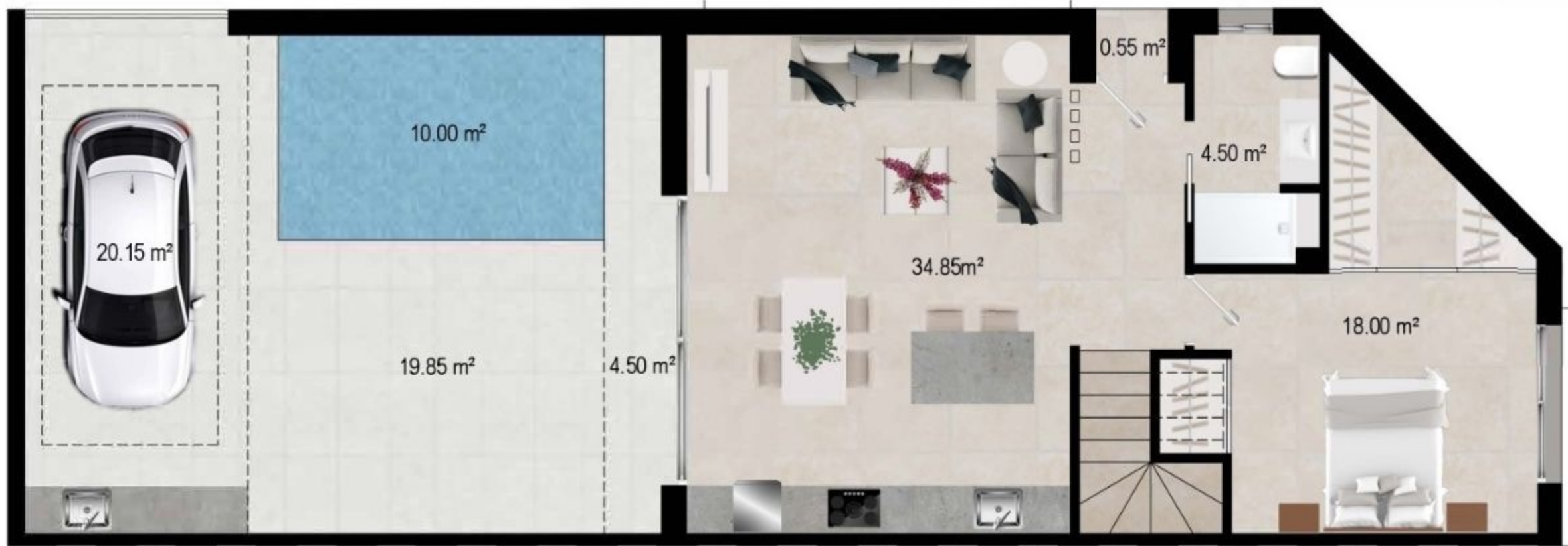
PLANTA BAJA / GROUND FLOOR