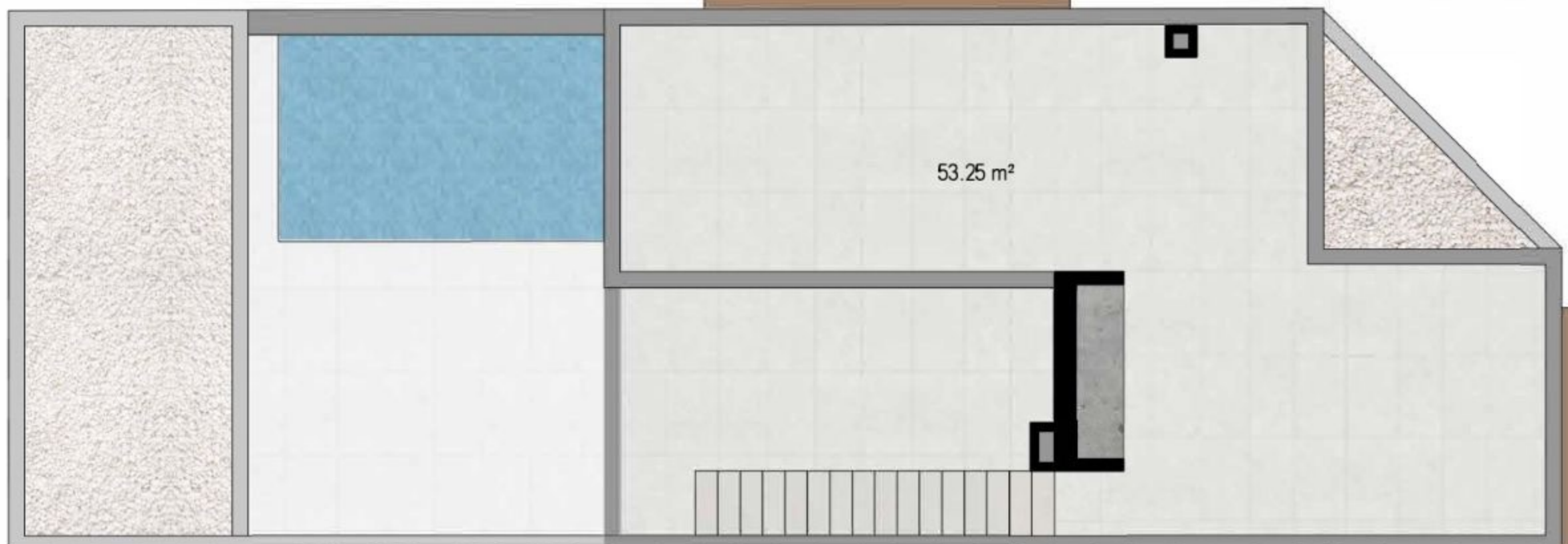
PLANTA TORREÓN / SOLARIUM