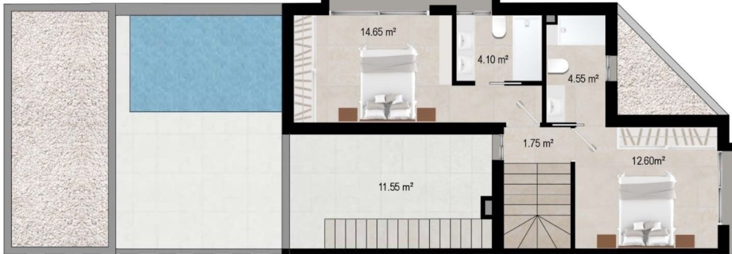
PLANTA PRIMERA / FIRST FLOOR